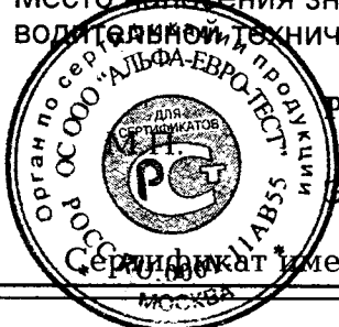
Схема сертификации № 3 Место нанесения знака соответствия по ГОСТ Р 50460-92 – на изделии, упаковке и в сопроводительной технической документации